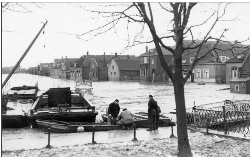
Reddingswerkers met boten in de Strijense Haven.

In de reeks “Strijen in Historisch perspectief” zijn ook boekjes uitgegeven en te koop in het museum betreffend dit onderwerp. Getiteld: “Watersnood” en “Twee weken in beeld.